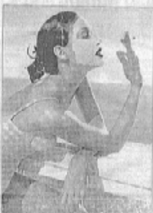
Desde Londres se creó el producto GivENCHY que extrae células de la piel y las vuelve a implantar en la zona con signos del tiempo.

«Este método que extrae una mínima cantidad de células de la piel y las vuelve a implantar en la zona con signos del tiempo, es una gran posibilidad de rejuvenecimiento en el rostro y se llama, en inglés, a lo que se le llama de manera coloquial, "skin lifting" o "skin lifting" de la piel. Como el pelo, la piel se produce en una zona específica de las células que se regeneran en el laboratorio y se vuelven a implantar en la zona con signos del tiempo».